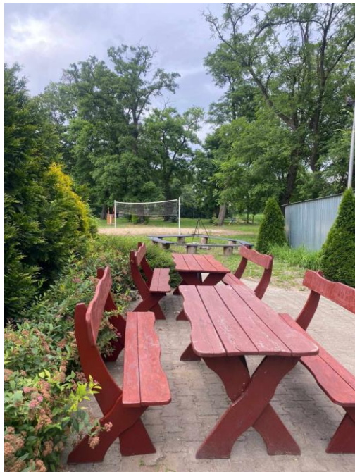
Miejsce spotkań i boisko

Z przeprowadzonej wizji w terenie sporządzono dokumentację fotograficzną.