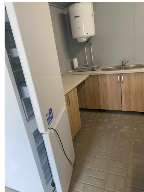
Kuchnia w Grzybku