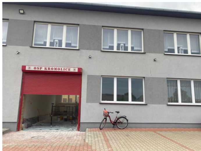
Sala wiejska i OSP