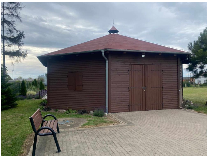
Wiata Grillowa – „Grzybek”

Z przeprowadzonej wizji w terenie sporządzono dokumentację fotograficzną.