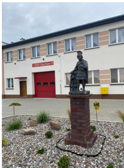
Sala wiejska i OSP